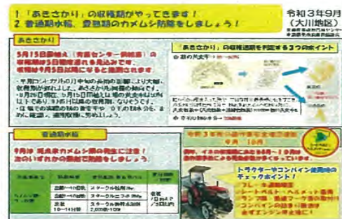
図一 営農ワンポイント情報

これまで「コシヒカリ」を栽培していた生産者に「あきさかり」を理解してもらうため、講習会等で品種の特性、「コシヒカリ」との栽培方法の違いを丁寧に説明した。また、月1回発行の営農ワンポイント情報や普及センター公式LINEを活用し、田植期別の生育状況や病害虫防除、適期収穫の呼びかけを徹底した。